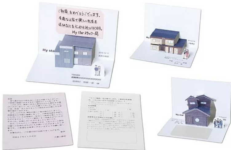
「ミニ新居」 工務店と顧客をつなげるコミュニケーションツール (第31回全日本DM大賞金賞グランプリ)