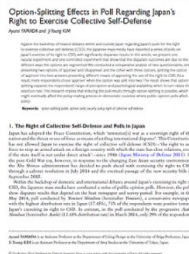
Yamada & Kim (2016; SSJJ) “Option-splitting effects in poll regarding Japan's right to exercise collective self-defense”