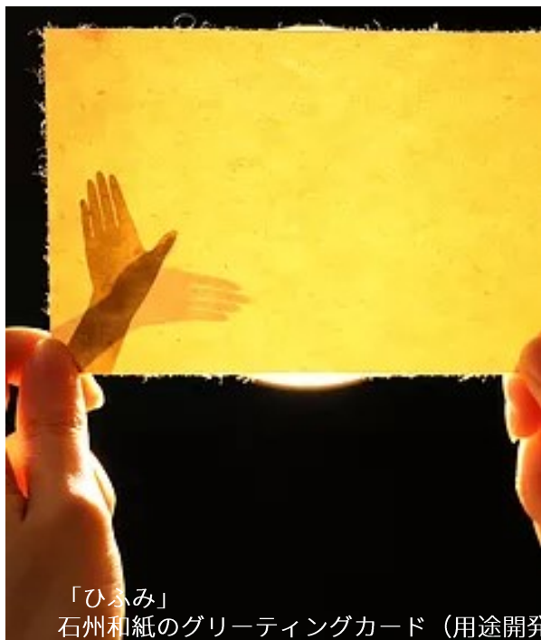
「ひふみ」 石州和紙のグリーティングカード（用途開発）